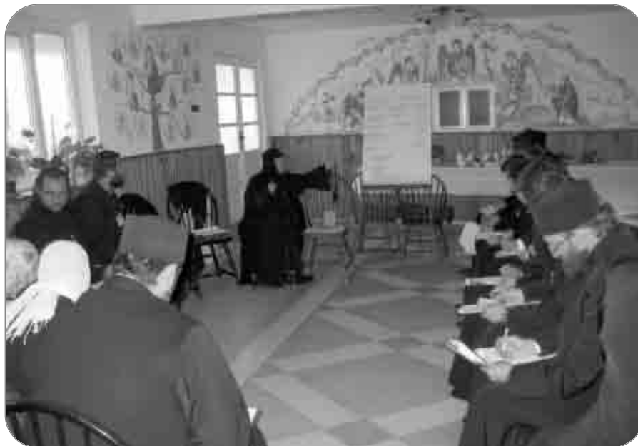
La cursul de formare de la Mănăstirea Tisa au participat 16 preoți din cadrul Eparhiei, precum și voluntari implicați în activitățile sociale desfășurate de Sectorul Misiune și Filantropie al Arhiepiscopiei Romanului și Bacăului