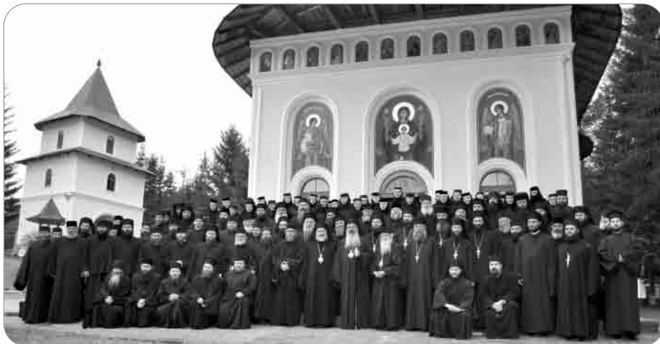
Sinaxa monahală mitropolitană de la Mănăstirea Durău a adunat 134 de stareți și starețe din Mitropolia Moldovei și Bucovinei