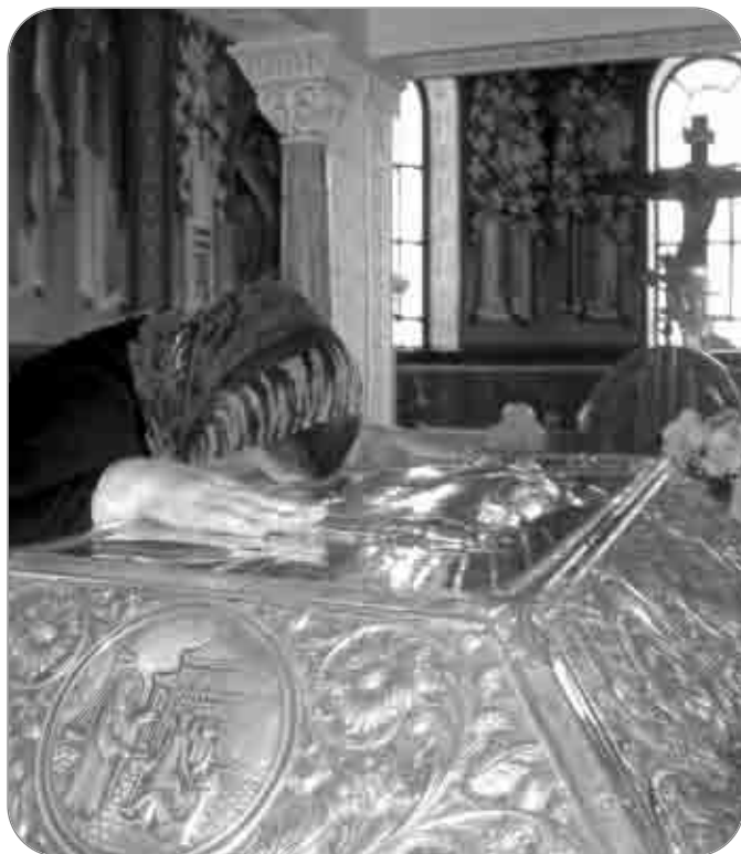
Racla cu moaștele Sfântului Nectarie