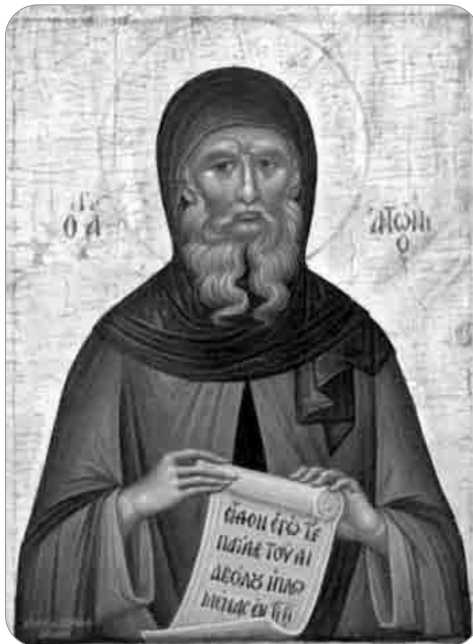
Sfântul Antonie cel Mare (251-356), considerat întemeietor al monahismului împreună cu Sfântul Pahomie cel Mare

Trebuie să aibă multă chibzuială în ceea ce poruncește, „nici să nu lase, nici să nu adauge ceva din cele ce plac lui Dumnezeu“, 13 împărțind fiecăruia ascultarea după putere și ținând seama dacă place lui Dumnezeu și este folositor întregii obști;