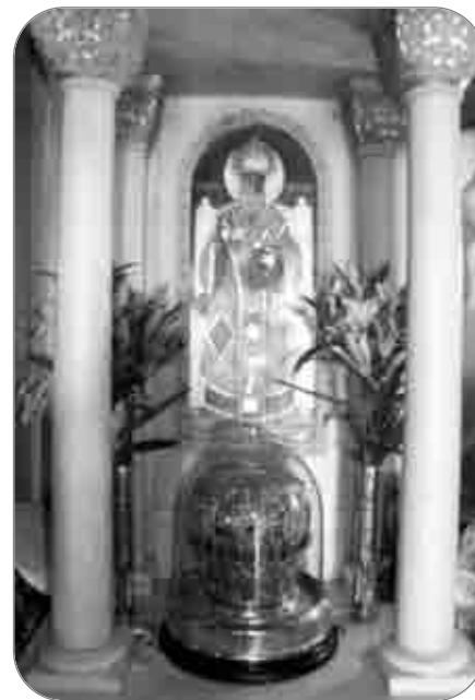
Capul Sfântului Nectarie, depus spre închinare sub o mitră aurită

După ce ne-am închinat la cinstitul cap al Sfântului Nectarie, acoperit cu o mitră aurită și așezat în mijlocul bisericii, am asistat în liniște la Sfânta Liturghie săvârșită de un numeros sobor de ierarhi și preoți. Mitropolitul Pantelei-