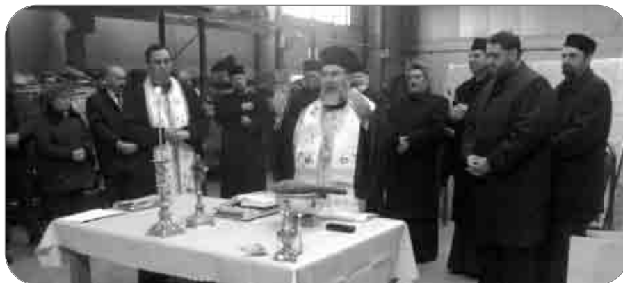
PS Episcop-vicar Ioachim Băcăuanul a binecuvântat ajutoarele destinate sinistraților din județul Bacău

Sub coordonarea PS Episcop Ioachim Băcăuanul, în județul nostru se desfășoară în perioada 22 noiembrie - 24 decembrie, un amplu program intitulat „Ramura de măsline”. Proiectul, derulat de Sectorul de Misiune și Filantropie al Arhiepiscopiei, are ca obiectiv creșterea calității vieții familiilor afectate de revărsările apelor, prin oferirea de articole de mobilier și aparatură electrocasnică distruse în locuințele familiilor sinistrate, în timpul inundațiilor. În urma evaluării situației pagubelor produse de inundații, au fost identificate un număr de 102 de familii, din localitățile Mărgineni, Măgura, Buda-Blăgești, Sânduleni și municipiul Bacău, care să fie beneficiare ale proiectului menționat. Fiecare familie va primi câte un produs nou electrocasnic (frigider, aragaz sau mașină de spălat) și unul de mobilier (pat sau dulap), în funcție de evaluările făcute la fața locului de către Sectorul Misiune și Filantropie. O altă activitate din cadrul proiectului o reprezintă alocarea de bani pentru construcția și reconstrucția a 5 case din