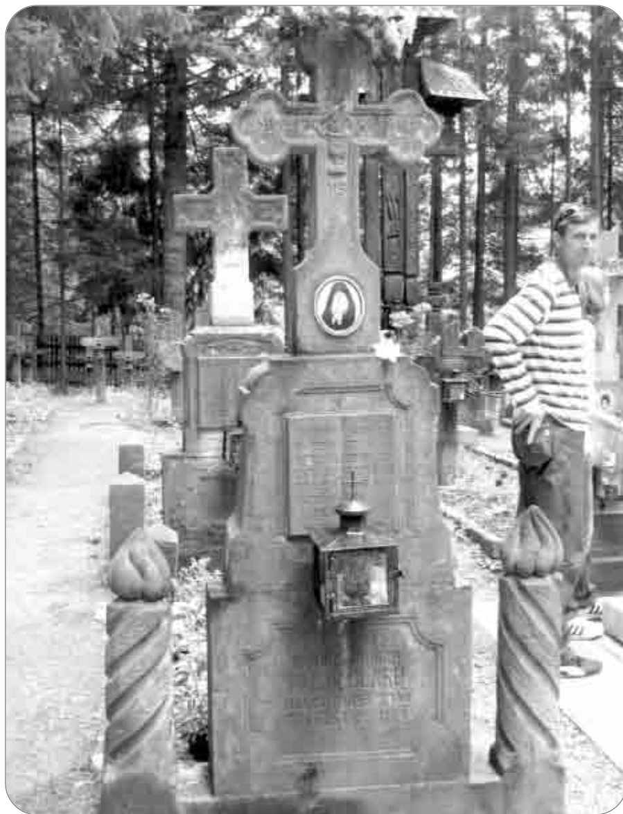
Mormântul părintelui Paisie Olaru, din liniștitul cimitir al Sihăstriei