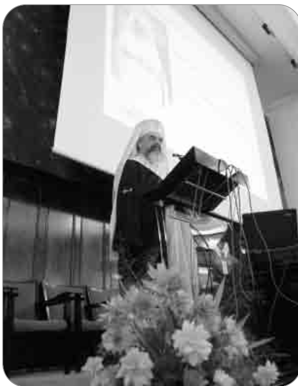
Preafericitul Părinte Patriarh Daniel, Doctor Honoris Causa al Universității „Al. I. Cuza” din Iași

† DANIEL, Patriarhul Bisericii Ortodoxe Române