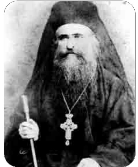
Cuviosul arhimandrit Irodion Ionescu, duhovnicul Sfântului Ierarh Calinic de la Cernica, a trăit în a doua jumătate a secolului al XIX-lea. Canonizarea sa a fost aprobată de Sfântul Sinod al BOR, în ședința din 29 octombrie

De asemenea, au fost prezente la acest eveniment membrii delegațiilor Patriarhiei de Constantinopol și Bisericii Greciei, membrii Permanenței CNB și Permanenței Arhiepiscopiei Bucureștilor, cadre didactice, protopopi, preoți, monahi, studenți teologi și elevi seminariști.