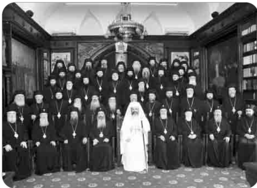
Sfântul Sinod al BOR este singura autoritate canonică care coordonează întreaga viață bisericească a românilor ortodocși din țară și străinătate

Bisericile autocefale ortodoxe au o constituție sacramentală și canonică-pastorală comună.