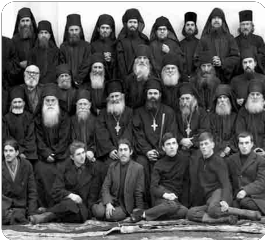
Obștea Mănăstirii Sihăstria, acum 40 de ani (Prea Sfințitul Ioachim Băcăuanul, pe atunci frate de mănăstire, este primul din dreapta jos)

fapte și evenimente pe care le-am trăit cândva. Mie însă mi-au rămas în suflet chipurile iconice ale acestor mari învățători și îndrumători, ce au exercitat asupra mea acea paternitate spirituală care m-a marcat pentru toată viața. De aceea spun adesea că la baza inițierii mele în viața monahală stau învățătura primită la școala dohovnicească a Părintelui Cleopa și povătuirile sfinte ale Părintelui Paisie.