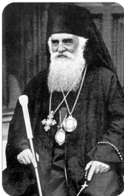
Miron Cristea, primul Patriarh al Bisericii Ortodoxe Române (1925-1939)

Biserica autocefală este o Biserică având conducere proprie sau de sine (în grecește autos = de sine, propriu; kefalé = cap, conducere). Organismul de conducere al unei Biserici autocefale este Sfântul Sinod prezidat de întâistătătorul acelei Biserici: patriarh, mitropolit sau arhiepiscop. Bisericile autocefale sunt Biserici surori, egale între ele și libere unele în raport cu altele în ceea ce privește organizarea întregii vieți bisericești.