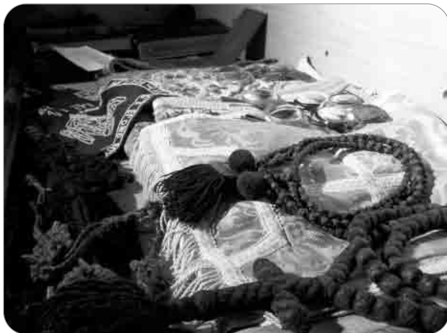
Câteva dintre obiectele care au aparținut părintelui Paisie