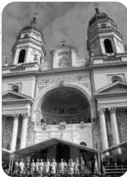
PS Episcop-vicar Ioachim Băcăuanul a făcut parte din soborul de ierarhi care a oficiat Sf. Liturghie arhierescă, sub protia PF Patriarh Daniel, din ziua Sf. Cuv. Parascheva la Catedrala mitropolitană din Iași

- a oficiat Sfânta Liturghie la Biserica „Sf. Cuvioasă Parascheva”, Parohia Sănduleni, Protopopiatul Onești. A rostit cuvânt de învățătură;