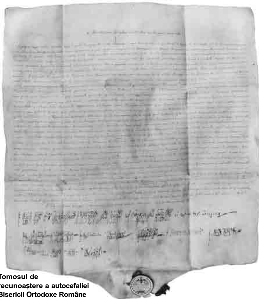
Tomosul de recunoaștere a autocefaliei Bisericii Ortodoxe Române

Spre deosebire de Protestantism, care se prezintă sub forma unei multimi de Biserici sau comunități confessionale diferite între ele în ceea ce privește atât doctrina credinței, cât și viața sacramentală și disciplina canonică, Ortodoxia, fidelă eclesiologiei apostolice și eclesio-